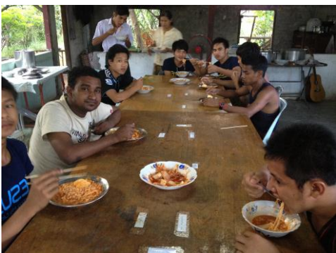
MTI 신학교 한국어 종강 떡볶이 파티

센터 방문 10 월엔 특별하게 주일마다 센터를 순회하며 예배 드리고 사역지를 방문하는 시간을 가졌습니다. 본 예배를 마치고 센터 별 주일학교 일정에 맞추어 달라 1,2 센터, 따웅다곤 센터를 방문했습니다. 사역자들 모두 열정적으로 사역하며 센터를 운영해 가는 모습에 마음 든든했던 시간이었습니다.