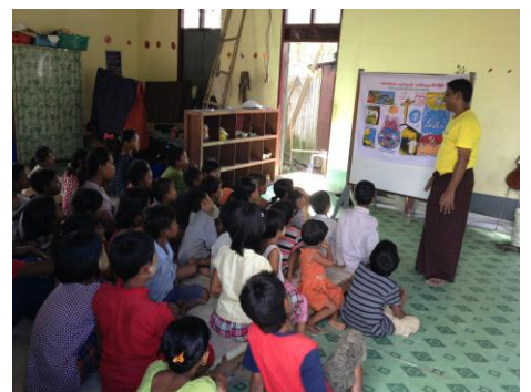
달라 2 센터 주일학교