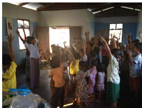
달라 1 센터 주일학교